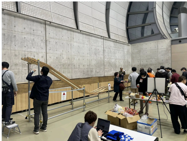
ナーディダービー

ナーディダービーという昼間、子供用に開催されているワークショップがあるのですが、合間に、これを自由にできる時間というのがあって、けっこうな大人が一生懸命になってやっているのも風情があってよかったかも。