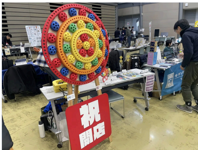
回転する開店祝い

あとの時間は、他の人のライトニングトークを聞いて過ごしましたが、面白い話が多く、昼間、他の人のブースを見て回らなくても、だいたいの内容が分かる感じでした。面白かったのは、公道を走るこたつを作っている人なので、市役所にナンバーの申請に書類をもって行って、「これは何ですか?」と言われた話とか、「回転する開店祝い」を展示していた人の着想とか、他の色々な作品の紹介とか、ヨガのシートを上手に巻ける道具を作っている人の話とか。