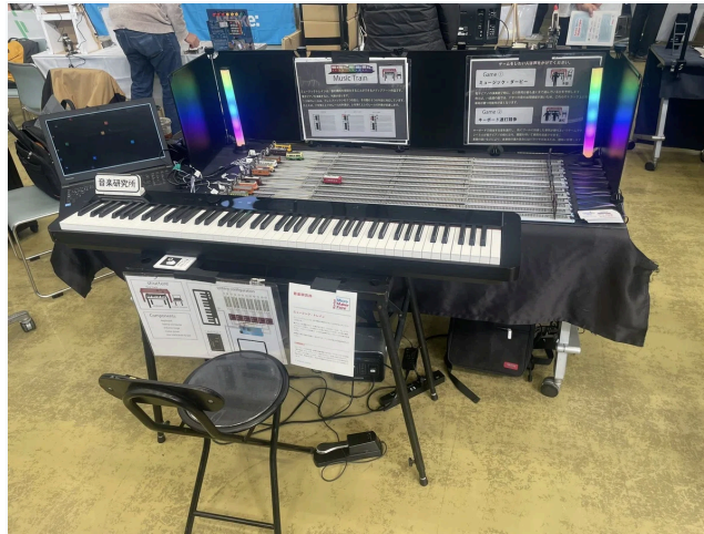
ミュージック・トレインの設置