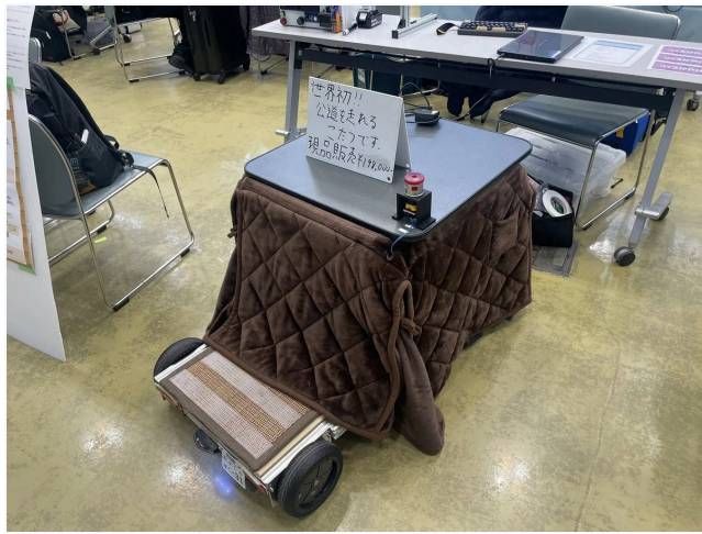
公道を走れるこたつ

ナーディダービーという昼間、子供用に開催されているワークショップがあるのですが、合間に、これを自由にできる時間というのがあって、けっこうな大人が一生懸命になってやっているのも風情があってよかったかも。